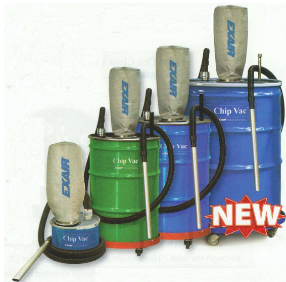
Aspiratori Chip Vac Exair disponibili per fusti da 20 100 200 400 litri