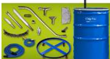
Esempio di aspiratore Premium Chip Vac con fusto da 100 litri e carrello in dotazione