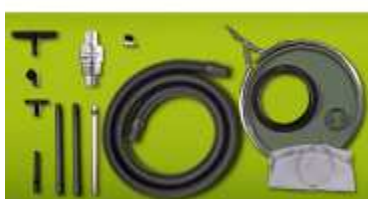
Esempio di aspiratore Chip Vac per fusti da 100 e 200 litri