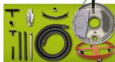
Esempio di aspiratore Deluxe Chip Vac per fusti da 100 e 200 litri