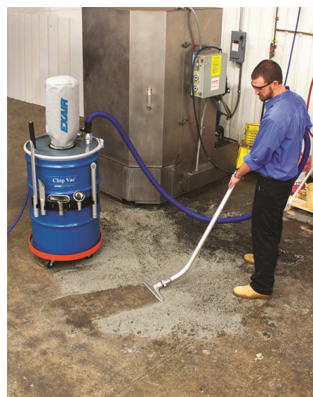
Deluxe Heavy Duty Chip Vac da 100 litri aspira granuli per sabbiatura