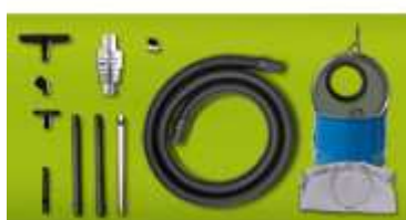
Esempio di aspiratore Mini Chip Vac con fusto da 20 litri in dotazione