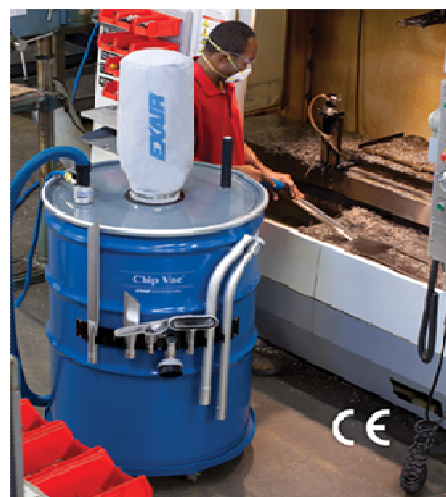
Premium Chip Vac da 400 litri aspira residui di lavorazione